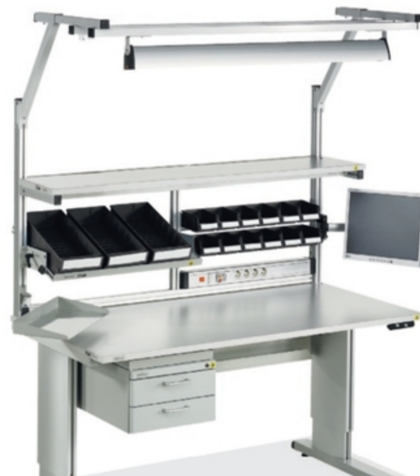
Tavolo da lavoro Treston.