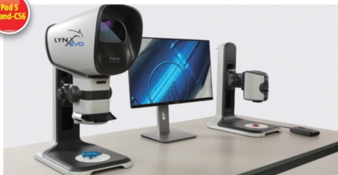
Lynx EVO ed EVOCam.

Espostiamo da diversi anni a Mecspe e riteniamo che sia un'ottima vetrina per l'industria manifatturiera e per le nostre apparecchiature. I prodotti Vision Engineering trovano impiego nel controllo qualità di diversi settori, quali ad esempio meccanica di precisione, stampati tecnici in plastica, elettronica, e Mecspe, grazie ai suoi diversi settori tecnologici e aree tematiche e al gran numero di visitatori qualificati ed espositori, è la fiera ideale per la presentazione delle nostre apparecchiature e delle nostre novità. Ci aspettiamo che anche l'edizione 2016 mantenga le aspettative in termini di affluenza e di successo e, come confermato nelle precedenti edizioni, attendiamo anche quest'anno una vasta partecipazione e un grande interesse verso i nostri prodotti.