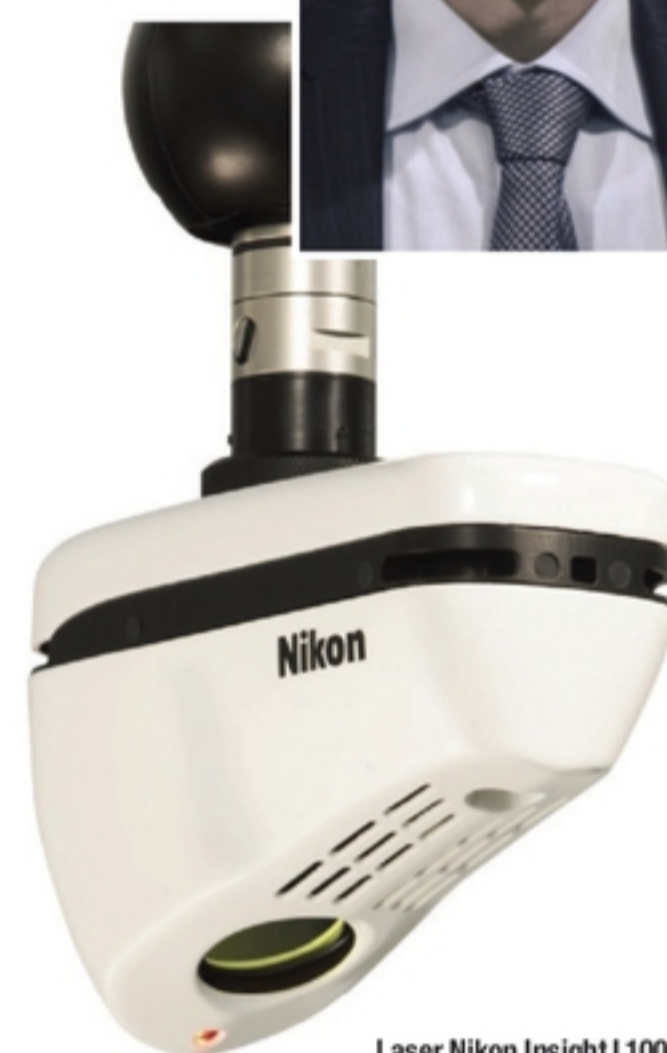
Laser Nikon Insight L100.